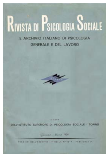
Il frontespizio del primo fascicolo della Rivista di Psicologia Sociale del 1954.

La Rivista di Psicologia Sociale , pur con una periodicità relativamente discontinua e con alcune evoluzioni sia di forma sia di contenuto, risulta essere potenzialmente viva ancora oggi.