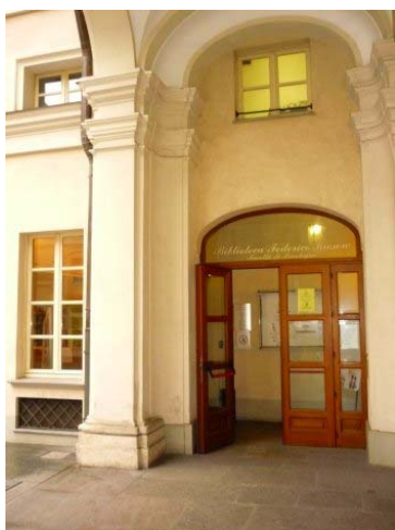
L'ingresso della Biblioteca Federico Kiesow, nel chiostro della Facoltà di Psicologia.

Poco dopo la fondazione della Facoltà di Psicologia (nel primo ciclo di presidenza), la biblioteca di facoltà viene intitolata a Federico Kiesow.