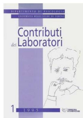
Il frontespizio del primo fascicolo dei Contributi dei Laboratori del 1995.

Una fotografia della copertina del primo numero dei Contributi dei Laboratori viene riportata qui oltre, riprendendola da una copia proveniente dalla biblioteca di chi scrive.