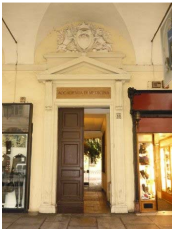
La sede storica originaria del Laboratorio di Psicologia a Torino, in via Po 18.

Kiesow collabora però soprattutto con Mosso e, a partire dal 1896, diventa ufficialmente assistente presso il suo Istituto di Fisiologia, con l'incarico specifico di occuparsi di psicologia.