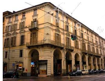
La sede relativamente più moderna del Dipartimento di Psicologia a Torino: in via Po 14.

In effetti, quanti continuano ad occuparsi dell'Istituto compiono un discreto sforzo per riportarlo nell'alveo della psicologia sperimentale vera e propria, o almeno in quello della psicologia scientifica in cui era nato. L'impregno sociale e la vitalità culturale rimangono assai vivi come elementi caratteristici dell'Istituto, assieme anche alla tradizione psicologico sociale, ma è soprattutto la psicologia, di base o applicativa che sia, che torna finalmente ad essere l'attività cui maggiormente si dedicano gli psicologi dell'Università di Torino.