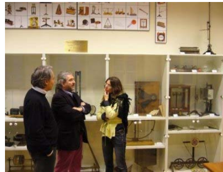
Il Direttore e i Redattori del Giornale di Psicologia nel Museo delle apparecchiature sperimentali per la ricerca psicologica, presso la Biblioteca Kiesow.

dei calici gustativi in alcune parti inesplorate del retrobocca. E l'inesperto studente d'allora sotto la guida del suo paterno maestro non solo portò a termine la ricerca facendone l'oggetto, studente ancora, di una sua comunicazione all'Accademia Medica di Torino, ma, per il fascino esercitato su di lui da Federico Kiesow, pei trent'anni ne rimase sotto la sapiente direzione quale assistente, posto che lasciò solo quando fu chiamato a succedere a Sante De Sanctis alla cattedra di Roma."