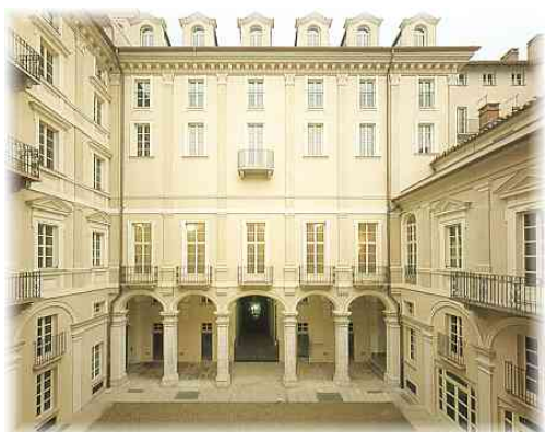
Il chiostro della sede attuale della Facoltà di Psicologia di Torino, con il Dipartimento di Psicologia: a Palazzo Badini in via Verdi 10.